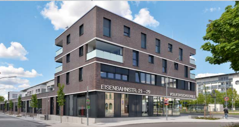
Wohn- und Geschäftshaus, Fellbach (35 Wohneinheiten, diverse Ladenlokale)