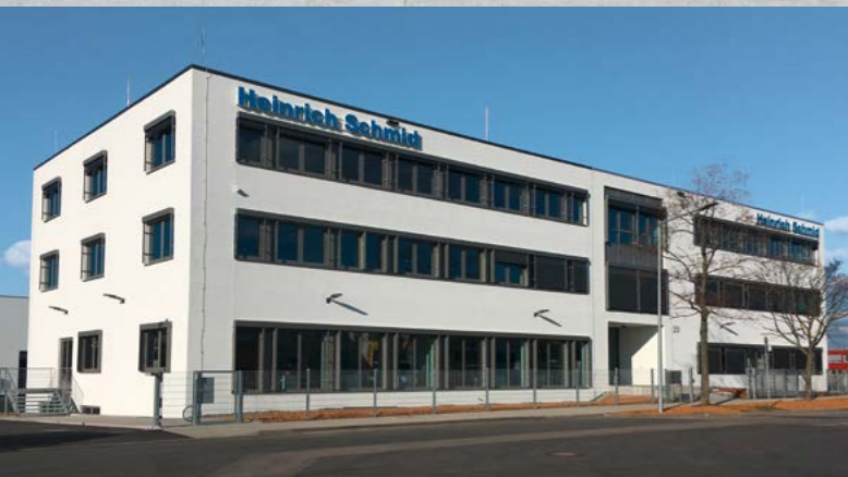
Büro- und Lagergebäude, Ludwigsburg