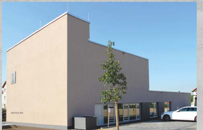
Neuapostolische Kirche, Wiesloch