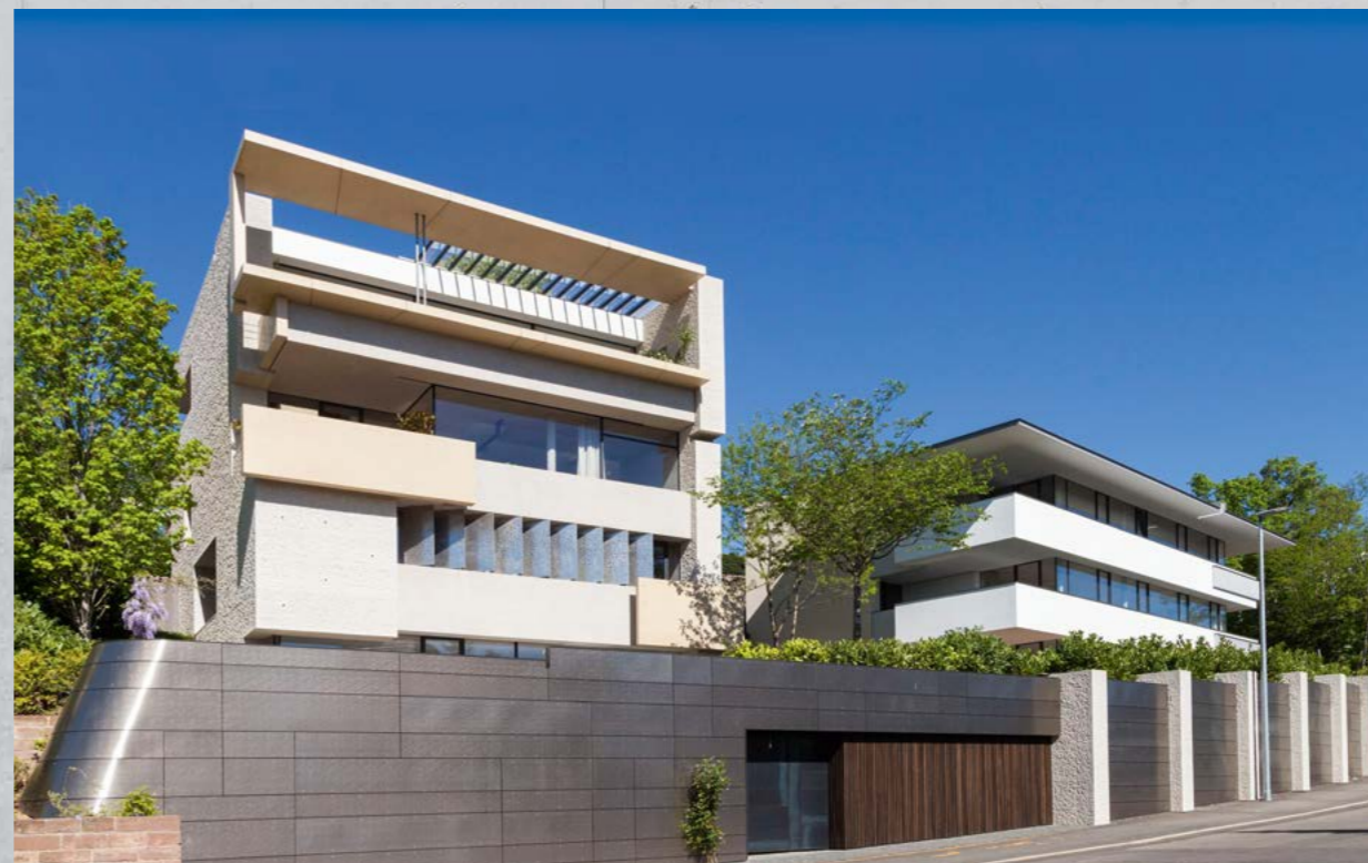
Parler Research Houses PR 39 und PR 41