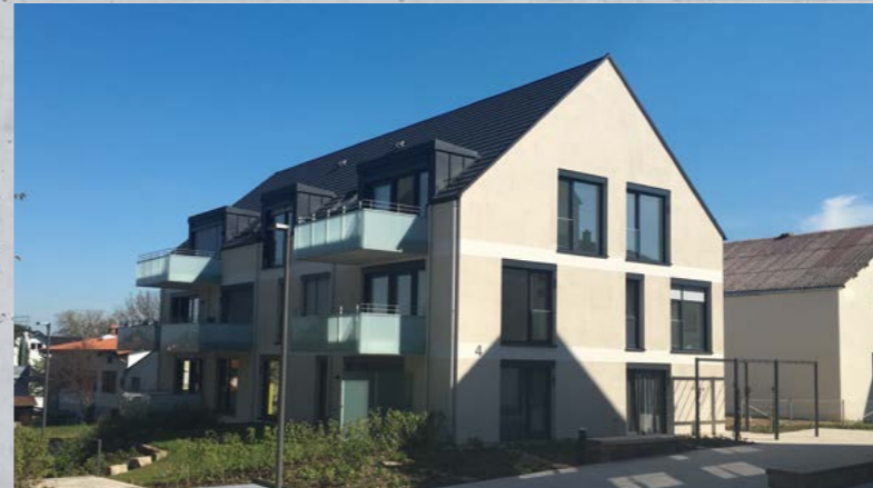
3 Mehrfamilienhäuser, Neckarwestheim (24 Wohneinheiten, 3 Gewerbeeinheiten)