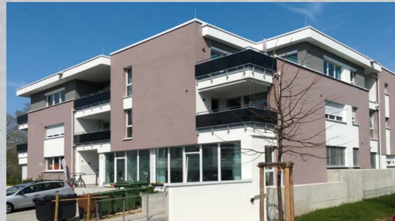
Betreutes Wohnen, Bietigheim-Bissingen, (21 Wohneinheiten, 1 Gewerbeeinheit)